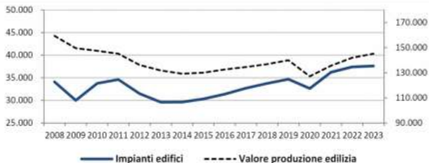
Dinamica complessiva del mercato italiano degli impianti per gli edifici comparata al valore della produzione in edilizia (mln di euro – prezzi costanti 2012)

Secondo l'ultimo Rapporto del CRESME il mercato impiantistico vale 32,6 miliardi di euro e assorbe il 25,7% delle risorse accrescendo il proprio ruolo nell'intera produzione edilizia.